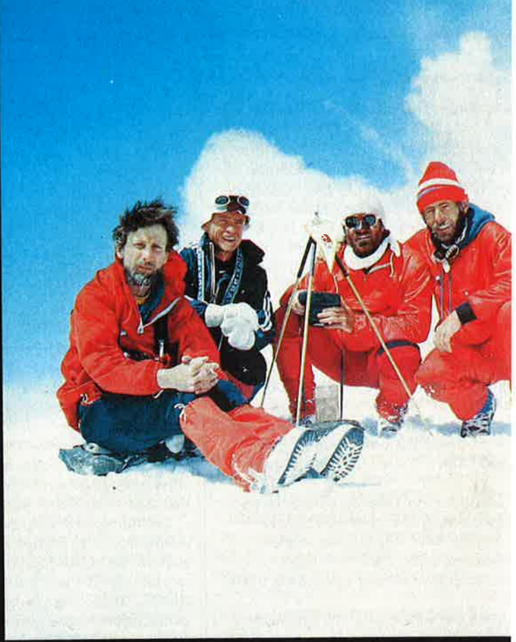
Den Aufstieg zum Pik Leipzig